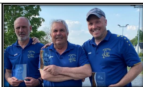
ALIDIÈRE – COMMUN – GRIMBERT Crépy en Valois