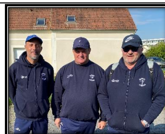
ZITOLY – JACQUET – BONZON Margny Lès Compiègne