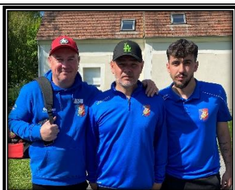
LELONG – GREUGNY – DROCOURT DIT VENET Choisy au Bac